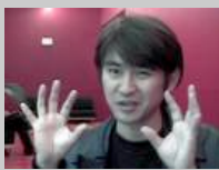
Tetsuya Mizuguchi (...)